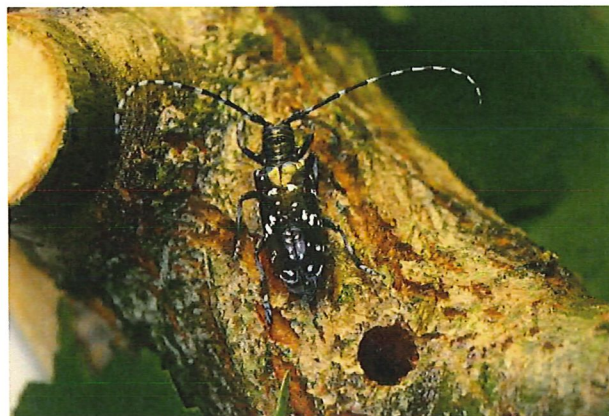
Foro di sfarfallamento