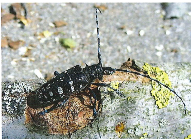
Il tarlo asiatico del fusto ( Anoplophora glabripennis )

Il tarlo asiatico del fusto ( Anoplophora glabripennis ) e il tarlo asiatico delle radici ( Anoplophora chinensis ) sono due coleotteri invasivi originari dall'Asia che possono provocare danni importanti a molte specie di latifoglie presenti sul nostro territorio. Regolamentati come organismi di quarantena prioritari, vige l'obbligo di notifica e di lotta. Il Cantone deve garantire il monitoraggio sul territorio e, in caso di ritrovamento, intervenire con delle misure molto costose quali l'abbattimento e la distruzione integrale tramite cippatura degli alberi infestati o abbattimenti preventivi di potenziali piante ospiti.