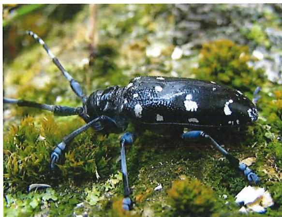
Il tarlo asiatico delle radici ( Anoplophora chinensis )