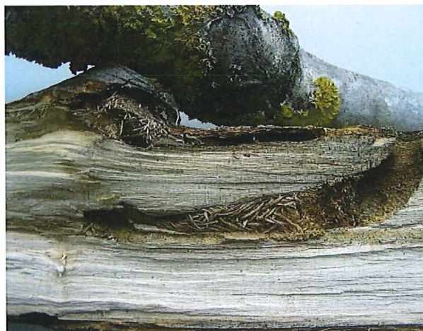
Albero danneggiato con le gallerie scavate dalle larve