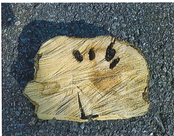
Tronco con le gallerie nutrizionali dalle larve del tarlo asiatico delle radici

Entrambi i tarli asiatici sono tra gli organismi dannosi più pericolosi al mondo per le latifoglie, con oltre 100 specie di piante ospiti: tra le più suscettibili si contano in particolare l'acero, l'ippocastano, la betulla, il nocciolo, il salice e il pioppo ( Anoplophora chinensis anche per gli agrumi e le rose). Il tarlo asiatico del fusto attacca il tronco e i rami delle piante mentre il tarlo asiatico delle radici colpisce la base del tronco e le radici. I danni principali sono causati dalle gallerie nutrizionali delle larve (ostruzione del flusso della linfa) e dai fori di sfarfallamento degli adulti (punto d'ingresso per marciumi secondari). I tarli asiatici scelgono di principio alberi sani, che muoiono in seguito al loro attacco nell'arco di pochi anni.